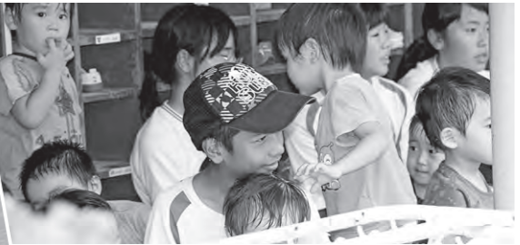
◀子どもたちとかけっこ