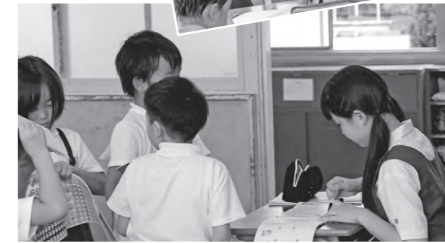
▲漢字ドリルを丸つけ

西浜保育所では、海田中学校と海田西中学校の生徒が、子どもたちと一緒に遊んだり、先生のお手伝いをしました。「子どもたちにいっせいに話しかけられたときの対応や泣き止ませるのが大変だった」、「1人のことだけでなく、周りを見て行動することや親に感謝することを学んだ」と保育士の大変さを実感していました。