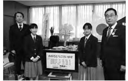
表敬訪問のようす ▲