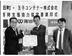
株式会社王子コンテナー ▲