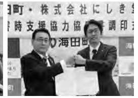
株式会社にしき堂 ▲