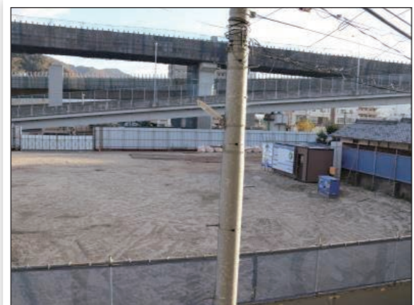
土壌汚染処理が済みました