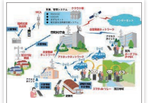
大災害でも機能する新庁舎業務継続計画を

に傷がないか慎重に把握し、適切な対応につなげるTICという技術を教員に研修させてはどうか。 答弁(教育長) 研究し検討する。 質問(議員) 福祉医療費の無料化を 質問(議員) ひとり親家庭などの医療費一部負担金を無料にしては。 答弁(町長) 財源確保が必要なため、考えていない。