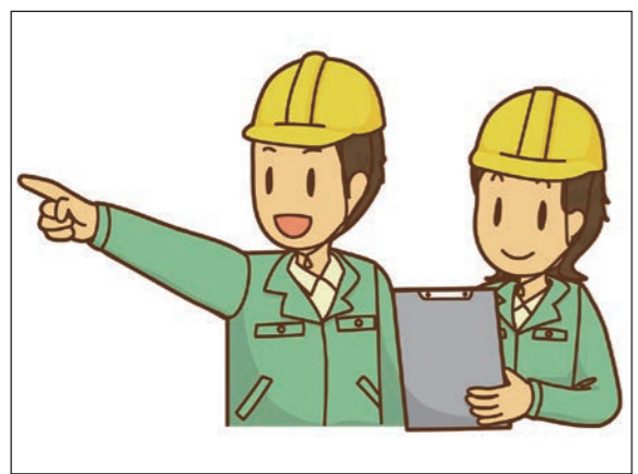
事前に十分調査を