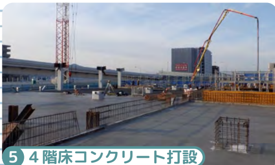
5 4階床コンクリート打設