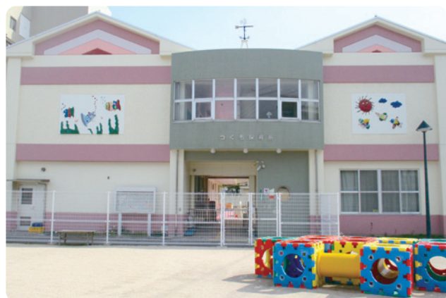
誰でも保育を受けられます