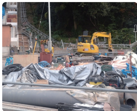
水道管を更新しています