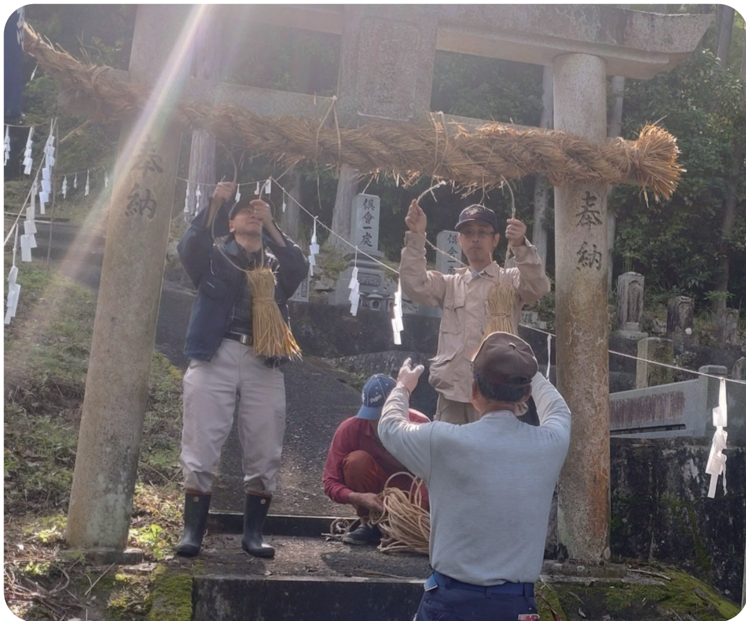
新年を迎える準備をしました