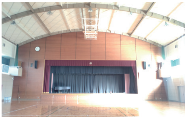
エアコンがつく予定