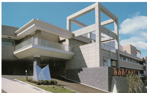
福祉避難所の1つです