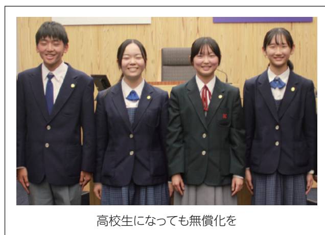
高校生になっても無償化を