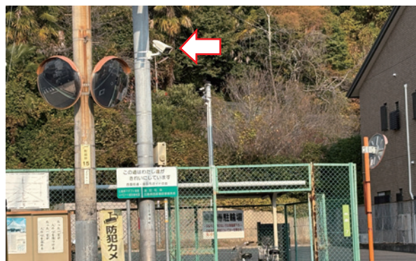
防犯のために増設を!!