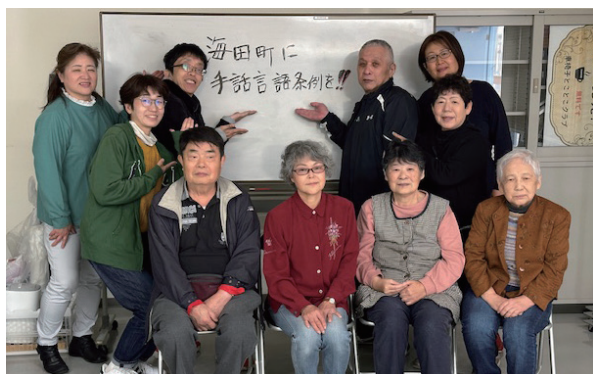
私たちにとって手話は言語です