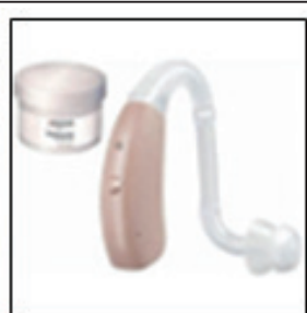
色々なタイプがあります