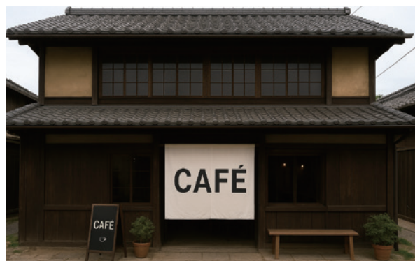
こんな活用例があります