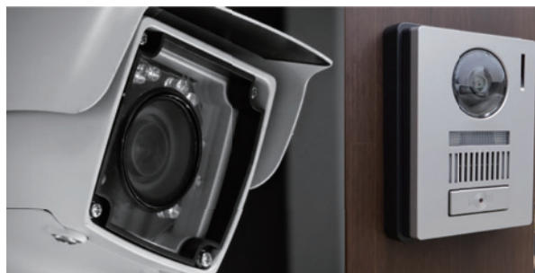
うちの町でも助成を