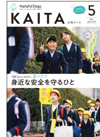
表紙:海田小学校の皆さん

海田町の人口 3月末現在(前月比) 人口 30,637(-62) 世帯 14,435(+38) 男 15,183(-27) 女 15,454(-35)