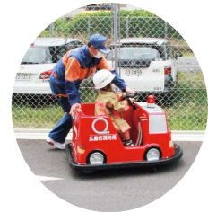
▲バッテリーカー試乗