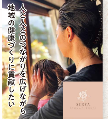
トータルセラピー スーリヤ 蟹原二丁目5-37

海田町の穏やかな雰囲気が大好きで、この場所に店舗を構えました。お散歩のついでにふらっと立ち寄っていただけるような、地域の皆さんに愛される温かい場所にしていきたいです。ぜひお気軽にお越しください。