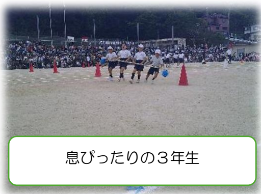
息ぴったりの3年生