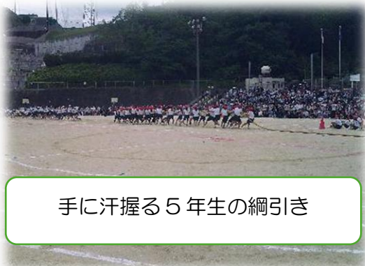
手に汗握る5年生の綱引き