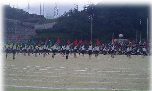
息のそろった6年生のフラッグ