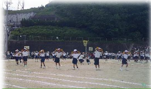
初めての運動会をがんばった1年生