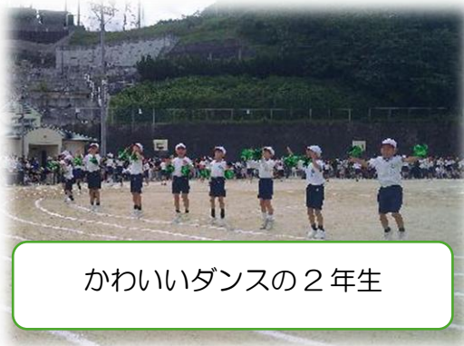
かわいいダンスの2年生