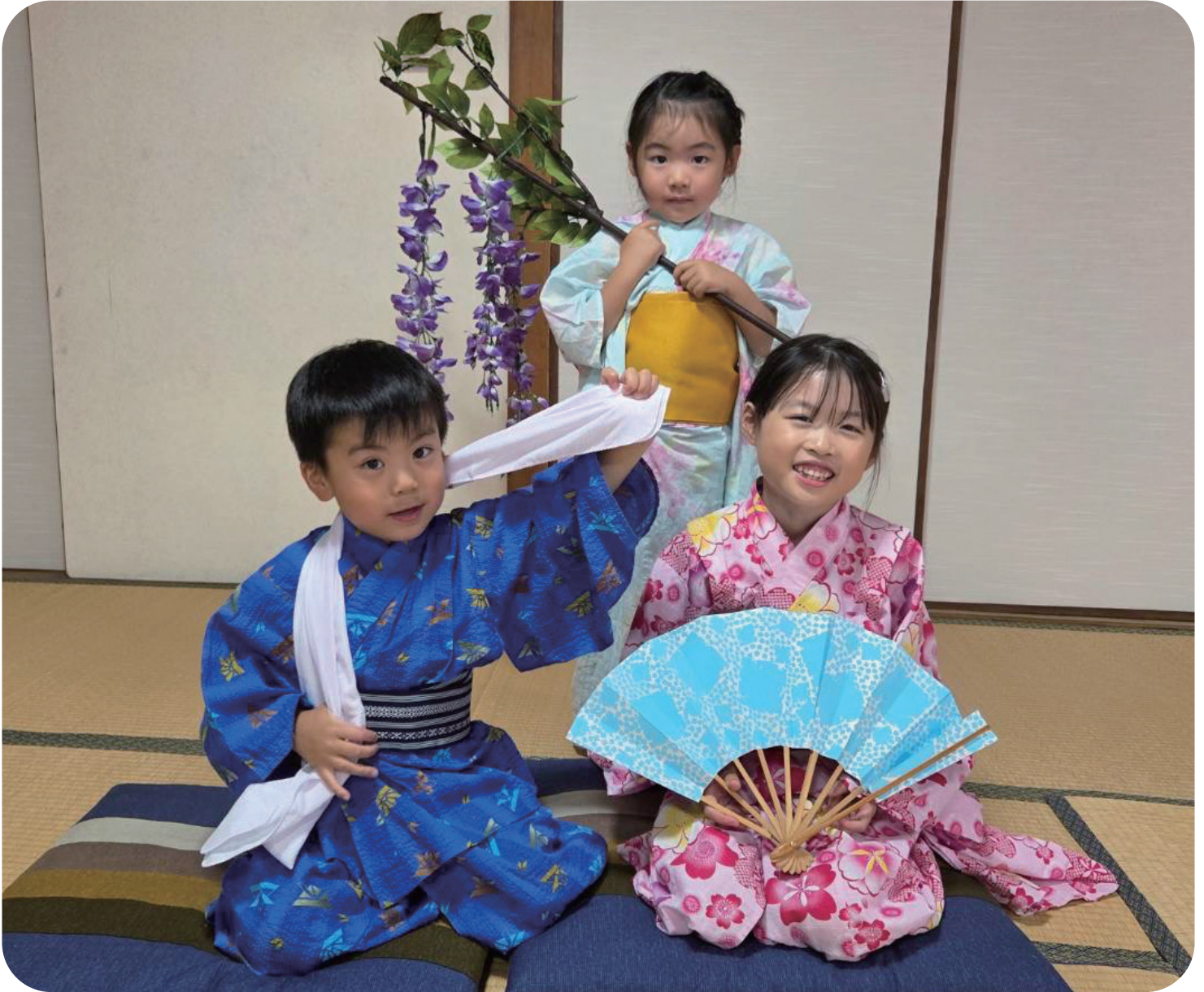
海田東公民館でまっています!