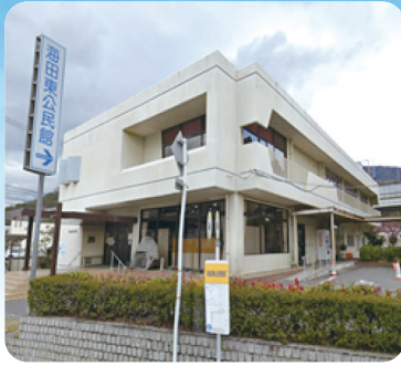
一步前進しました

老朽化した海田東公民館の再整備をベースに整備位置や手法を再整理し、公共施設の再編・再整備の方向性を検討します。今後の事業推進に向けた基本構想・計画を策定します。 7月下旬までに委託業者の公募、プレゼンテーション・審査を行います。 (最終ページに関連記事あり)