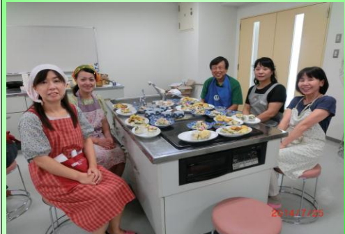
■ゴーヤを使って、美味しく出来た料理・・・5品です