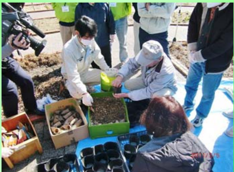
■栽培講習会も開催しています！【毎年3月頃】