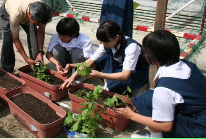
■海田西中学校でも緑のカーテンづくりに挑戦しました！