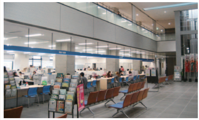
新庁舎の窓口(玉名市)

一方、新宮町では、「そびあ新宮」と「シーオーレ新宮」の2つの施設を視察しました。どちらも多様な設備を有しており、特色のある施設となりました。今回の調査により、公共施設の整備については、町の特色や住民のみなさんのニーズを踏まえる