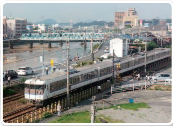
新しい駅ができたらいいな