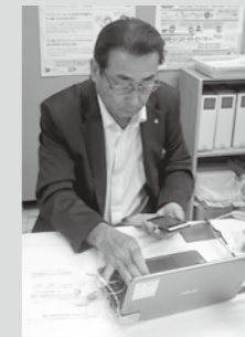
町長もやっています!

マイナンバー制度について、不明な点、不安な点などありませんか? 困ったことがあれば、役場などに相談したり、次のところを参考にしてください。