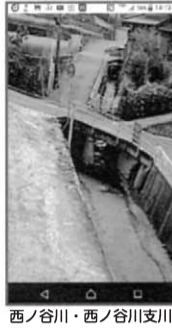
西ノ谷川・西ノ谷川支川

まだ復旧は道半ば、早期の復旧・復興に全力被災者支援センター、被災者に寄り添う早めの避難に向け、情報伝達を工夫災害に強いまちをつくる